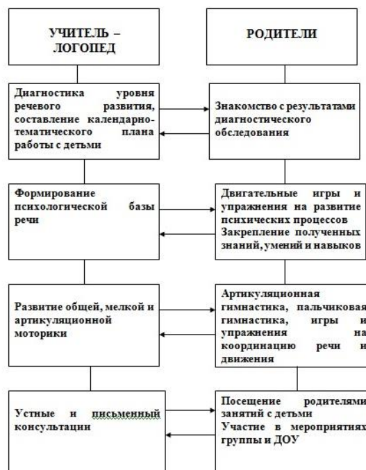
МОДЕЛЬ ВЗАИМОДЕЙСТВИЯ УЧИТЕЛЯ-ЛОГОПЕДА С РОДИТЕЛЯМИ

Без постоянного и тесного взаимодействия с семьями воспитанников коррекционная логопедическая работа будет не полной и не достаточно эффективной. Поэтому интеграция детского сада и семьи – одно из основных условий работы учителя-логопеда в условиях логопедического пункта . Модель взаимодействия с семьями детей, имеющими нарушения речи,