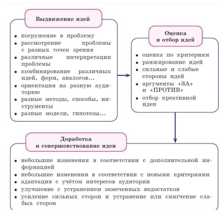
Рисунок 2. Действия, требуемые при выполнении заданий на креативность

Алгоритм работы с учебной ситуацией или учебной задачей описан Г.С. Ковалёвой, О.Б. Логиновой и др. в учебном пособии для общеобразовательных организаций «Креативное мышление. Сборник эталонных заданий» 1 и представлен на рисунке 2.