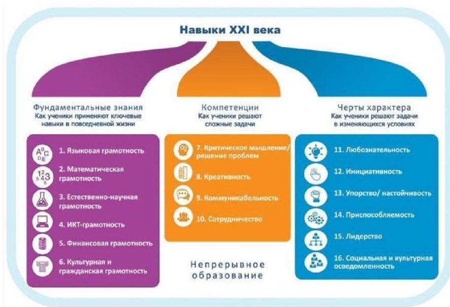
Рисунок 1. Образовательная модель World Economic Forum

форума была разработана и представлена в докладе «Новый взгляд на образование» модель, включающая в себя три типа образовательного результата: знания предметных областей с акцентом на функциональные грамотности, включая ИКТ-грамотность, компетенции 4К и качества характера.