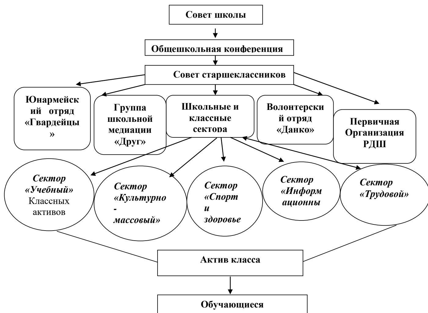
Схема самоуправления МБОУ Школы №5